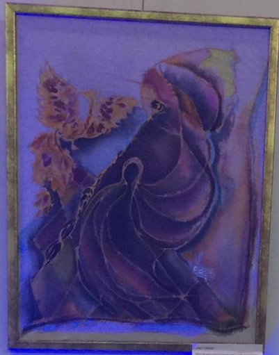
ARTIST'S NAME TITLE OF THE WORK MATERIALS USED DATE OF CREATION