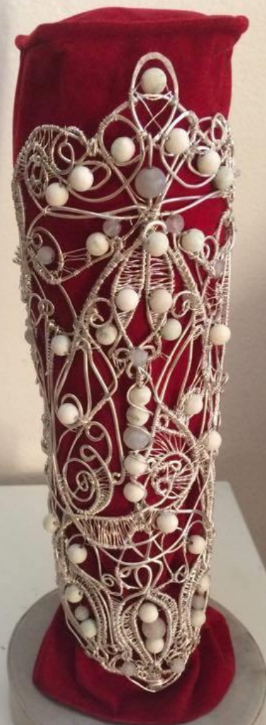
С.Н. Ручно плетена посребрена нарукваница са полудрагим каменом белог корала и млечног кварца. Уникат. Дизајн и израда накита: Сандор/На-Весна В. Максимовић